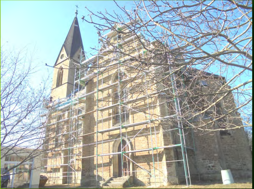
Unser Kirchendach wird neu eingedeckt