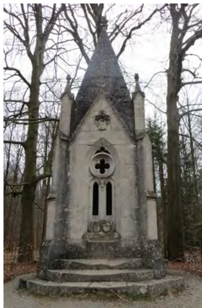
Denkmal zur Erinnerung an die Vorkommnisse am Tetzelsstein

Als Ludwig der Weise (1463-1525) den Eintreibern in seinem Fürstentum, mit dem Residenzszitz Wittenberg, diese Handlungen verbot, strömten die verunsicherten Bewohner in das nahe gelegene brandenburgische Jüterbog. Die appellierenden Worte Luthers in der Wittenberger Schlosskirche konnten zunächst die Ängste der Menschen nicht mindern. Erst die Verbreitung von Luthers 95 Thesen zur Reformierung der Kirche 1517 brachte nach und nach die Aufklärung der Bevölkerung. Sein mutiges Vorgehen setzte Luther dem päpstlichen Zorn aus und gefährdete ihn zeitweise an Leib und Leben.