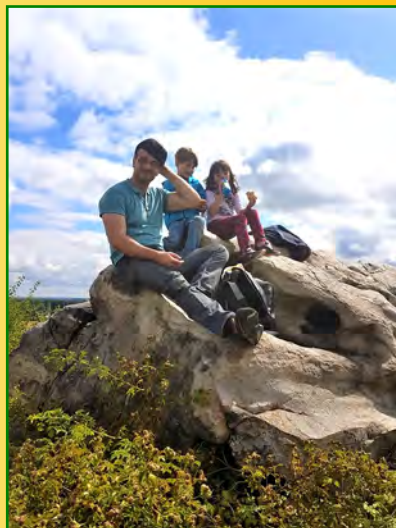
August 2017: Kleine Radtour zur Dreibogenbrücke mit Picknick