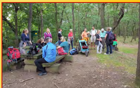
September 2017: Wanderung mit dem Harzklub Bad Suderode entlang der Harzer Wandernadel