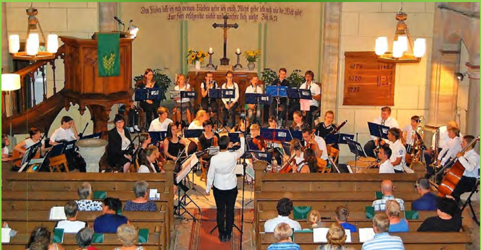
Das Jugendorchester „Capella Juventa“ begeisterte die Bad Suderöder und zahlreiche Gäste