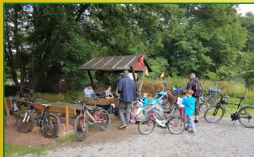
Juli 2017: Große Fahrradtour zur Teufelsmauer mit Picknick