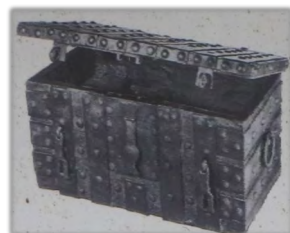
Geldtruhe in Braunschweiger Museum, die für den Ablasshandel eingesetzt wurde.

Einer von den skrupellosesten Ablasshändlern war der Dominikanermönch Johann Tetzel. Er wirkte hauptsächlich in der Kirchenprovinz Magdeburg und wurde sogar 1517 vom Erzbischof Albrecht II. von Mainz und Magdeburg zum Subkommissar für dieses Vorhaben berufen. So soll er in der ursprünglichen Überlieferung bei diesem miesen Handel folgenden Anspruch gebraucht haben: „Sobald der Gülden im Becken klingt, in huy die Seel in Himmel springt.“ In etwas modernerer Version wurde dann später zitiert: „Wenn das Geld im Kasten klingt, die Seele in den Himmel springt.“