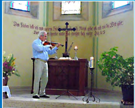
Sprengelgottesdienst in Warnstedt