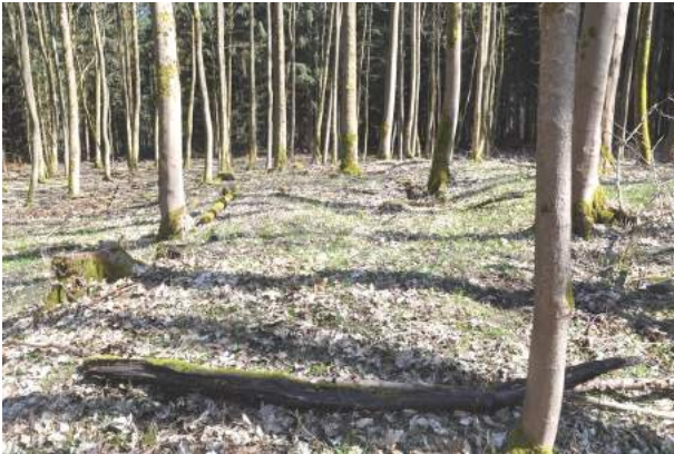
Apsis Kirche Bischoferode