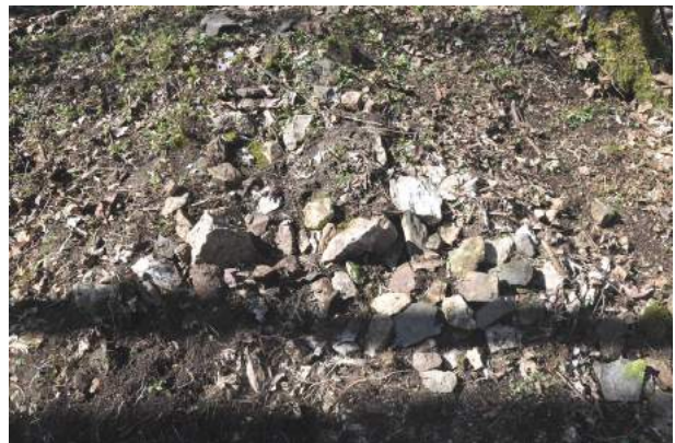
Umrisse Kirche Bischoferode