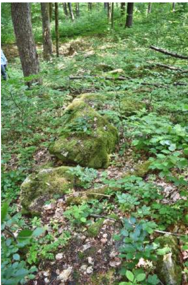
Gerichtssteine in Ritzgerode