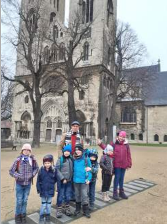
Ausflug nach Halberstadt zum Domschatz

in Quedlinburg „Haltestelle“, Ägidiikirchhof 6,