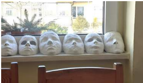
Wir haben Gipsmasken hergestellt