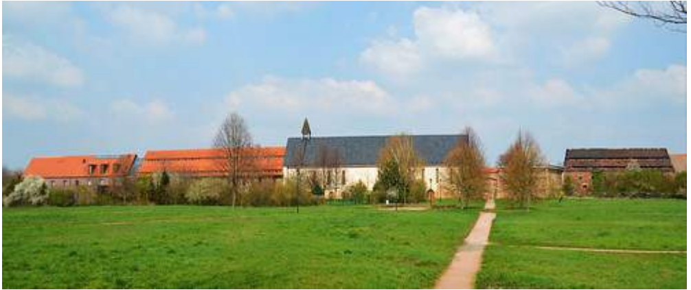
Das Kloster Helfta heute

Mit der Reformation wurden viele Frauenklöster aufgelöst, und das Frauenbild veränderte sich.