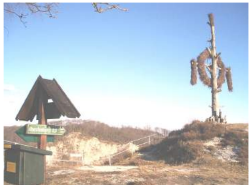
Der Sonnenradbaum in Questenberg/Südharz

Ein nachweislich uralten Brauch, der bis in germanische Zeiten zurückreichen soll, wird heute noch im Südhärzer Ort Questenberg (Raum Sangerhausen) begangen. Dienstag nach Pfingsten, dem sogenannten