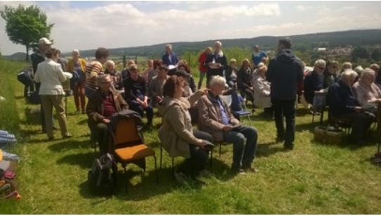
Himmelfahrtsgottesdienst am Großen Königstein Westerhausen