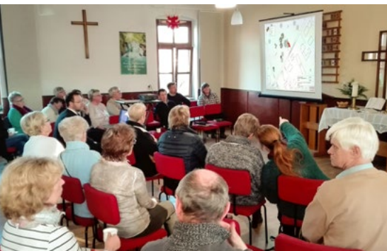
Gut besuchte Gemeindeversammlung