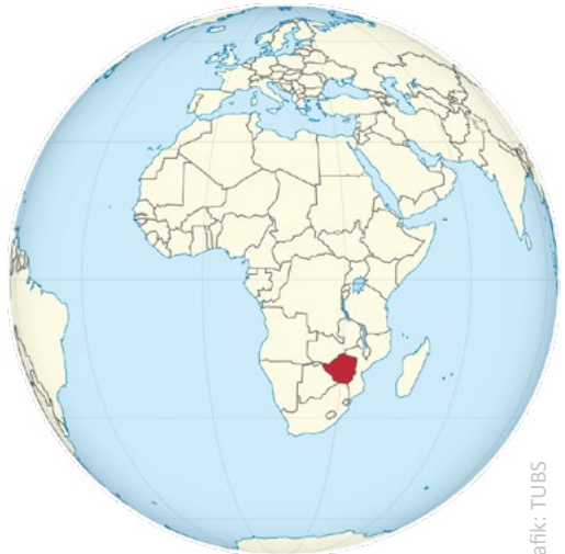
Lage der Republik Simbabwe

In über 120 Ländern organisieren und gestalten Frauen jedes Jahr den Weltgebetstag am ersten Freitag im März. In diesem Jahr stellen uns Frauen aus Simbabwe ihr Land vor und nehmen uns mit hinein in ihren Alltag, ihre Freuden aber auch in die Probleme, die es in diesem Land gibt. Auch musikalisch und kulinarisch werden wir mit hineingenommen. Natürlich ist das Gebet für die Frauen und das Land ein wichtiger Teil des Tages. Ökumenisches Miteinander wird beim Weltgebetstag seit Jahrzehnten ganz selbstverständlich gelebt. Und so feiern auch wir diesen Tag wieder gemeinsam mit unseren Katholischen Geschwistern. Also lassen Sie sich herzlich einladen zum Weltgebetstag am 6. März 2020 um 17 Uhr in die Gemeinderäume der ..... Kirche Thale.