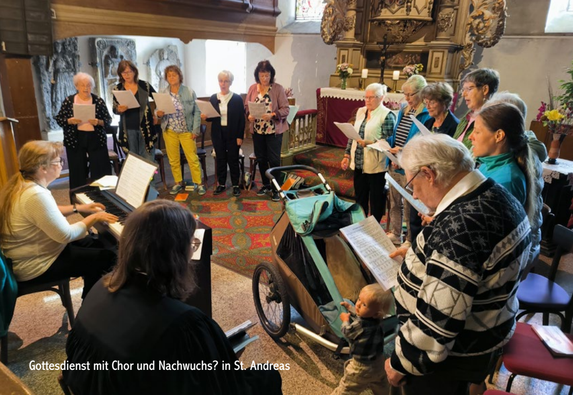
Gottesdienst mit Chor und Nachwuchs? in St. Andreas